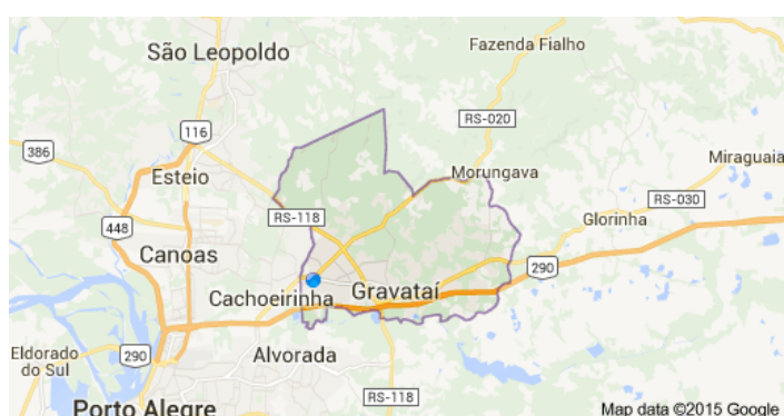
Figura 1 – Posicionamento Geográfico de Gravataí

Gravataí possui uma área de 497,82 km 2 , com uma população de 269.022 habitantes (BRASIL. Ministério da Saúde. DATASUS, 2015a). Localizada 22 km a noroeste da Capital Porto Alegre, tendo as rodovias BR 290 e RS 020, 030 e 118 como principais vias de acesso, e limitando-se ao norte com os municípios de Novo Hamburgo e Taquara, ao leste com Glorinha, e a oeste com Cachoeirinha e Sapucaia do Sul.