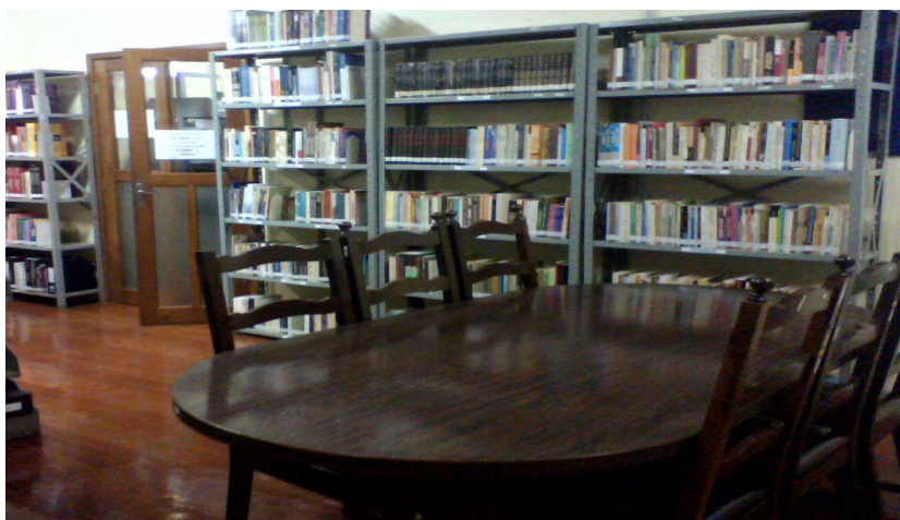
Figura 4 - Sala de Estudos

Segundo Briquet Lemos (2005), para se ter uma biblioteca, no sentido de instituição social, é preciso que haja cinco pré-requisitos: a intencionalidade política e social, o acervo e os meios para sua permanente renovação, o imperativo de organização e sistematização, uma comunidade de usuários, efetivos e potenciais, com necessidades de informação conhecidas ou pressupostas, e, por último mas não menos importante, o local, o espaço físico onde se dará o encontro entre os usuários e os serviços da biblioteca.