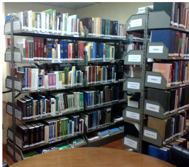
Figura 2 – Estante de livros.