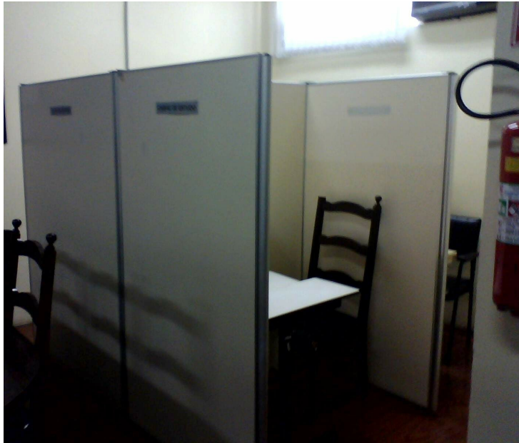
Figura 5 – Cabine de Estudos