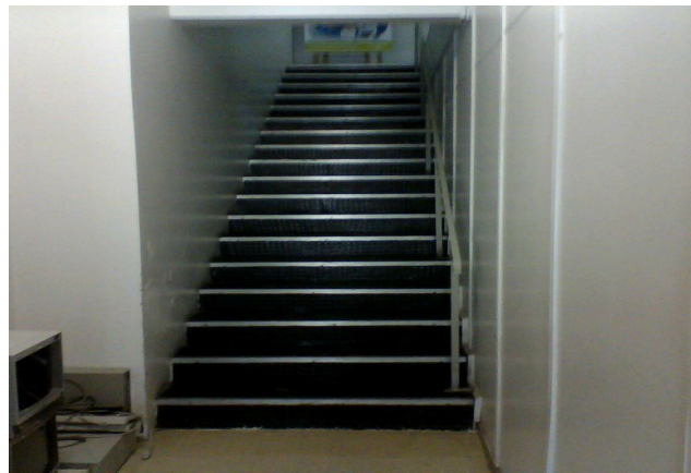
Figura 1 - Acesso à Biblioteca.

Entretanto, as leis estão disponíveis e devem ser incorporadas por todos visando à melhoria nas relações entre os deficientes e os não deficientes e o acesso a todo e qualquer lugar, se tomarmos como referência ao disposto por Mazzotta (2006), ao relatar que as dificuldades e limitações das condições de acesso aos bens e serviços sociais e culturais configuram uma das mais perversas condições de privação da liberdade e da equidade nas relações sociais que são fundamentais para o ser humano.