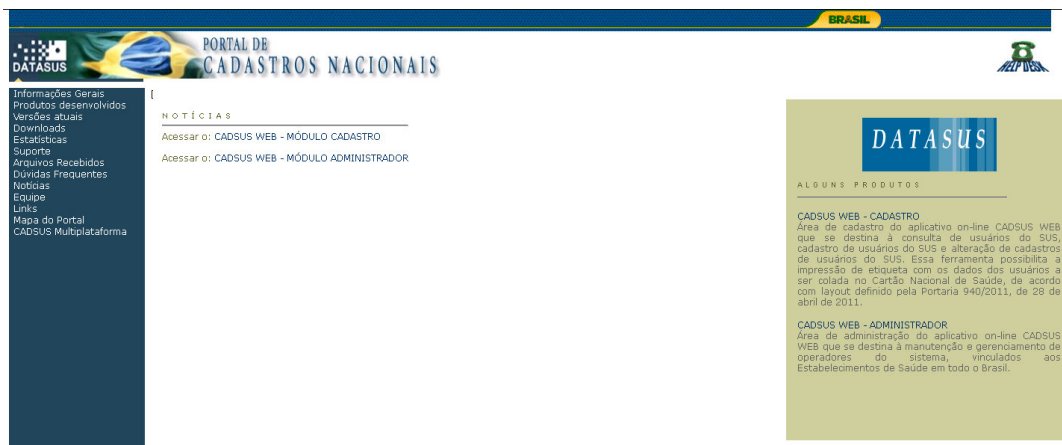
Figura 1: Tela do sistema CADSUS.

Na segunda etapa, esses prontuários passam por uma análise detalhada feita por funcionários do setor para todos os serviços prestados, onde são colocados os códigos do SUS referentes às patologias, cirurgias, tempo de internação, diárias de acompanhantes para serem faturados. Para assessorar os funcionários, tem dois médicos auditores para garantir, por meio de controle que a segurança da informação seja respeitada. Nesse ínterim é feita a conferência do cartão SUS – cartão nacional de saúde através do programa CADSUS - portal nacional de cadastro de cartões do Sistema Único de Saúde, que tem por objetivo, identificar os usuários do Sistema Único de Saúde (SUS) seus domicílios de residência; seus serviços utilizados e valores gastos pelo usuário.